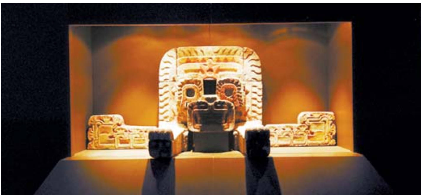
JAGUAR DE XALLAY Cultura teotihuacana