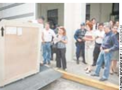
INVITADO Las obras llegaron a Mérida bajo un fuerte dispositivo de seguridad

Consta de secciones que muestran la evolución de Pablo Picasso, a través de diversas técnicas gráficas, y es acompañada de conferencias que explorarán el papel del artista en el desarrollo de las vanguardias pictóricas. La muestra es coordinada por el ayuntamiento de Mérida y su par de Málaga, a través de la Fundación Picasso y el Museo Casa Natal, patrimonio de esta institución y del Estado español. (Notimex)