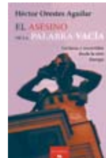
ANTOLOGÍA Dialoga con autores de diversas épocas

■ EN 2004 llega a la Embajada de México en Uruguay, y en 2008 a la Embajada de Austria